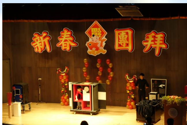
●清華大學魔術社表演