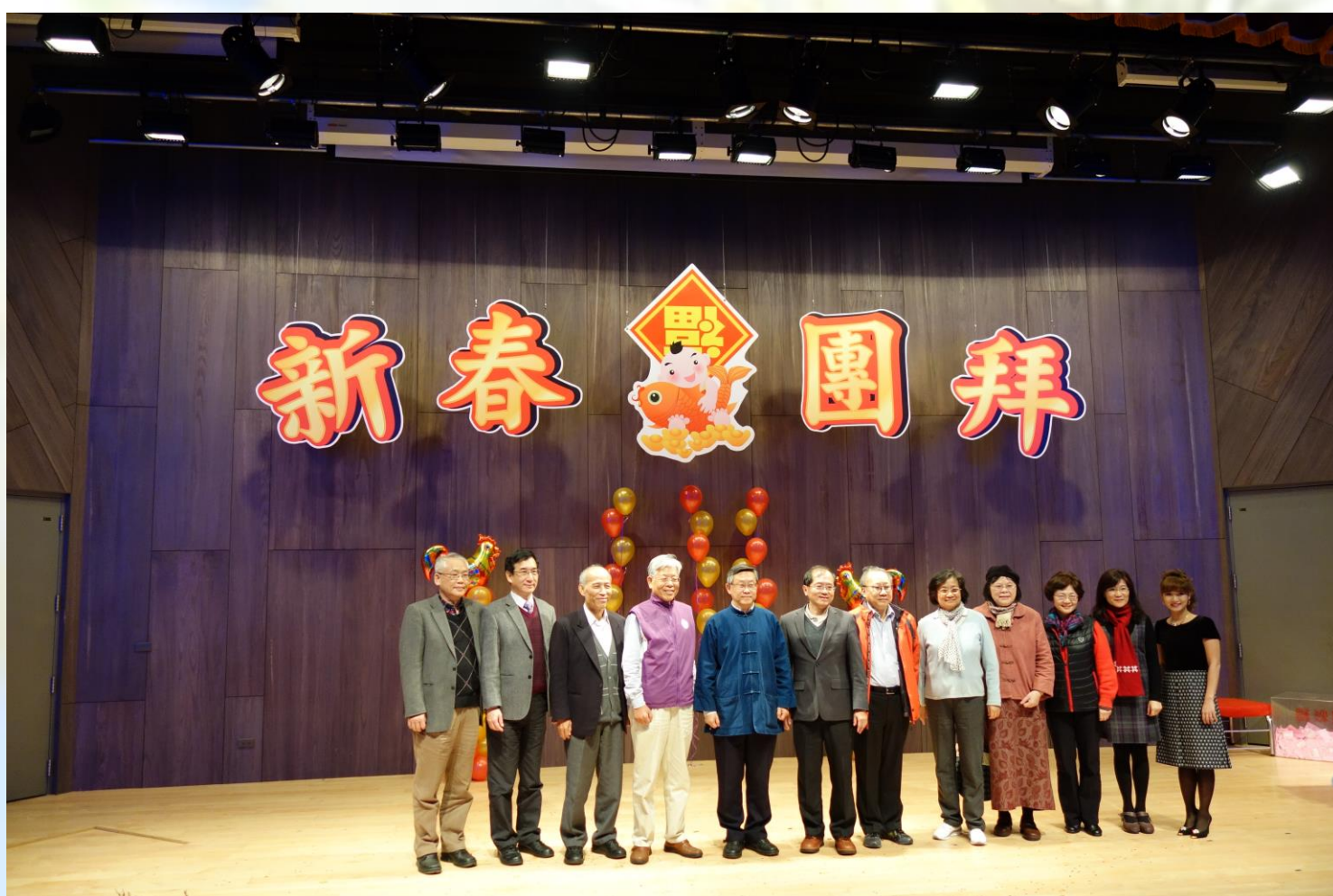
●清華大學長官合影