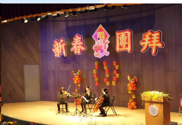
●南大校區音樂系同學演奏